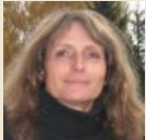
KRENN INGE WWW.IKO-ART.AT KUNSTSTRASSE 7