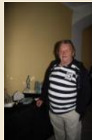
GERLICH ROBERT BILDER, SKULPTUREN KREATIVMEILE 12