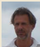
GREINER JOSEF MALEREI – OBJEKTKUNST KREATIVMEILE 23