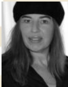
LAROUSSE SUZE COLLAGEN WWW.SUZELAROUSSE.JIMDO.COM KREATIVMEILE 21