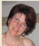
METZNER EDITH BEMALTE STEINE KUNSTSTRASSE