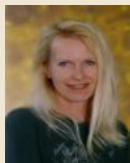
HOLZBAUER MONIKA KERAMIK RELIEFS WWW.MONIKA-HOLZBAUER.NET KUNSTSTRASSE 5