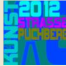
LENGL SVETLANA ACRYLBILDER FISHTOPIA-PROMENADE 1