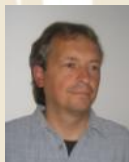
HIRL MANFRED SKULPTUREN AUS SPECKSTEIN WWW.MANFRED-HIRL.AT KREATIVMEILE 17