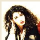
REINHART MARTINA BILDENDE KUNST WWW.ARTREINHART.AT KUNSTSTRASSE 9