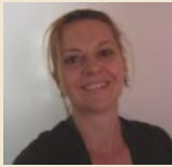
BRANDSTETTER MARION LANDART WWW.MARIONBRANDSTETTER.COM KUNSTSTRASSE 6