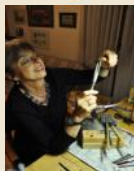
GOLL-VOLPINI EVA LIVE GLASPERLENKUNST WWW.GLASPERLENKUNST.AT KUNSTSTRASSE 2