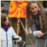
BELAY JASMIN LIVE-STRASSENKUNST RIESEN-SEIFENBLASEN FISHTOPIA-PROMENADE