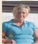
ZMUGG ANNA SEIDENMALEREI FISHTOPIA-PROMENADE 2