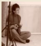
HAUNSCHMIDT REGINE FOTOKUNST WWW.NAHAUFNAHME.AT KUNSTSTRASSE 4